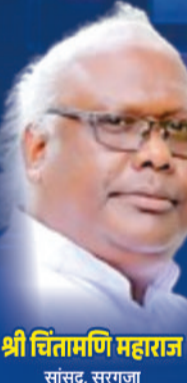
श्री चिंतामणि महाराज सांसद, सरगुजा