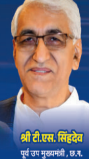
श्री टी.एस. सिंहदेव पूर्व उच्च मंत्री, छ.ग.

28 फरवरी 2026, शनिवार, समय: दोपहर 03 बजे से