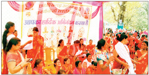
हरिभूमि व्यूज ►► जशपुरनगर

संयुक्त मंच के आह्वान पर तीन सूत्रीय मांगों को लेकर छत्तीसगढ़ आंगनबाड़ी कार्यकर्ता सहायिका संघ के बैनर तले भारी संख्या में आंगनबाड़ी कार्यकर्ताएं सहायिकाएं दो दिवसीय हड़ताल पर सड़क पर उतर गई हैं, इस दौरान इनके द्वारा धरना प्रदर्शन करते हुवे जशपुर के रणजीता