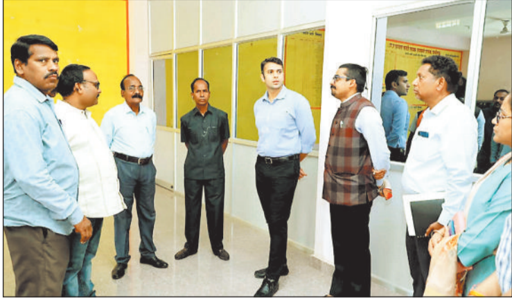
नगर पंचायत के सीएमओ और अन्य कर्मचारियों से चर्चा करते कलेक्टर।

कलेक्टर ने शाखावार पदस्थ कर्मचारियों की संख्या, उनकी जिम्मेदारियों और कार्यप्रणाली की समीक्षा करते हुए निर्देश दिए कि सुचारू संचालन के लिए जितने अतिरिक्त मानव संसाधन की आवश्यकता हो उसका आकलन कर विभागीय कार्यालय को शीघ्र मांग पत्र प्रेषित किया जाए तथा उसकी एक प्रति कलेक्टर कार्यालय को भी उपलब्ध कराई जाए। इस संबंध में नव पदस्थ मुख्य नगर पालिका अधिकारी सीएमओ को आवश्यक निर्देश दिए गए। निरीक्षण के दौरान नव मनोनीत अध्यक्ष, उपाध्यक्ष एवं सदस्यों ने